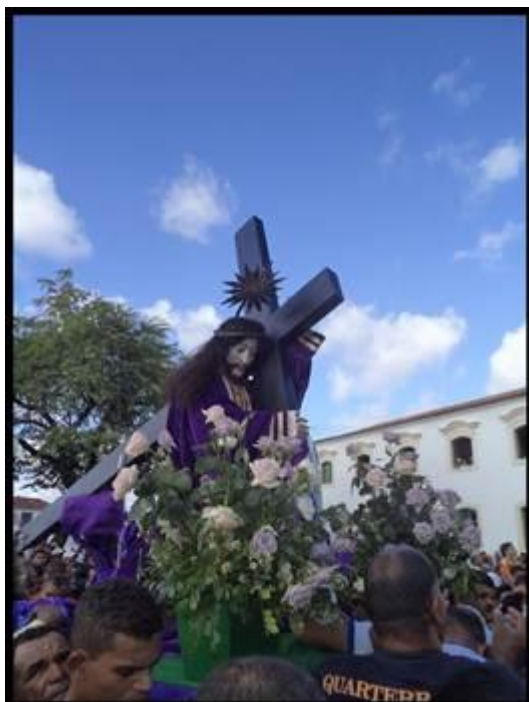
Figura 1 – Procissão do Senhor dos Passos

No centro antigo da cidade sergipana de São Cristóvão, a 26 km da capital Aracaju, é realizada a festa com a procissão ao Nosso Senhor dos Passos (Figura 1). De acordo com Fragata (2006, p. 22), “não é possível datar com exatidão o início da maior romaria de Sergipe, os indícios acenam que tudo começou no final do século XVIII ou início do XIX”. O Inventário de Bens Móveis e Integrados do IPHAN, feito a partir de entrevistas com pessoas responsáveis pela comemoração, 5 diferentemente do autor anteriormente citado, documenta que a Festa do Senhor dos Passos teve início no ano da transferência da capital, em 1855. Tanto em consulta aos documentos, como nas entrevistas e depoimentos, a oralidade dá a tônica quando os assuntos são o período do achado da imagem e do início da festa.