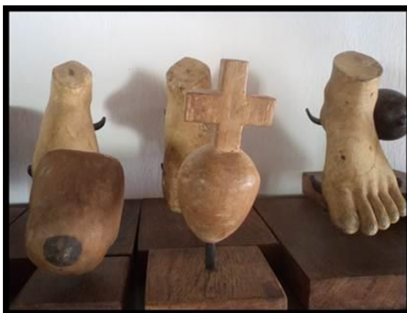
Figura 5 – Ex-votos de Madeira Representando Partes do Corpo Humano Acervo Museu Ex-votos de São Cristóvão-Sergipe

Algumas peças são confeccionadas em madeira, gesso, argila e parafina, vinculadas às partes do corpo humano. Compõe acervo do museu em São Cristóvão fotografias, esculturas, quadros, cruzes, mechas de cabelo, recados, sandálias, sapatos, chaveiros, pernas mecânicas, próteses, aparelhos de coluna partes do corpo humano (pedras de rins, umbigos de crianças), dentre outros.