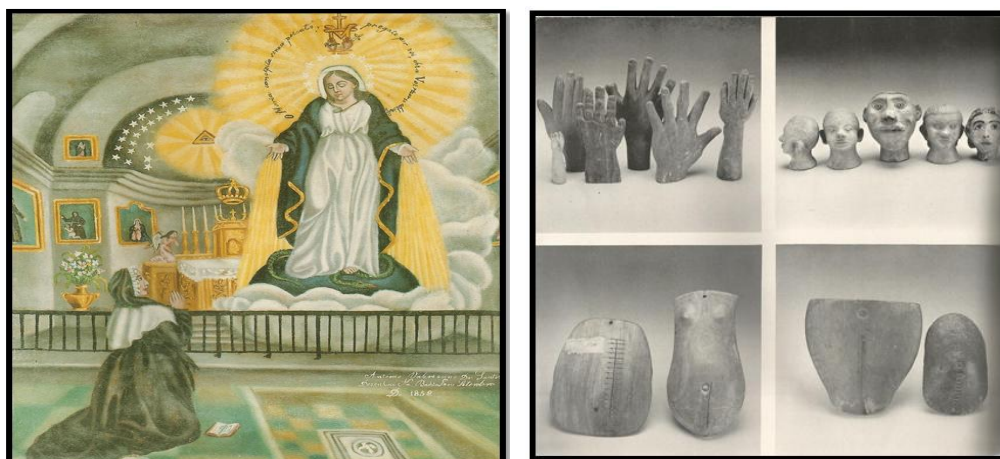
Figuras 2, 3 e 4 – Imagens do Catalogo do Museu do Ex-voto de São Cristóvão-Sergipe