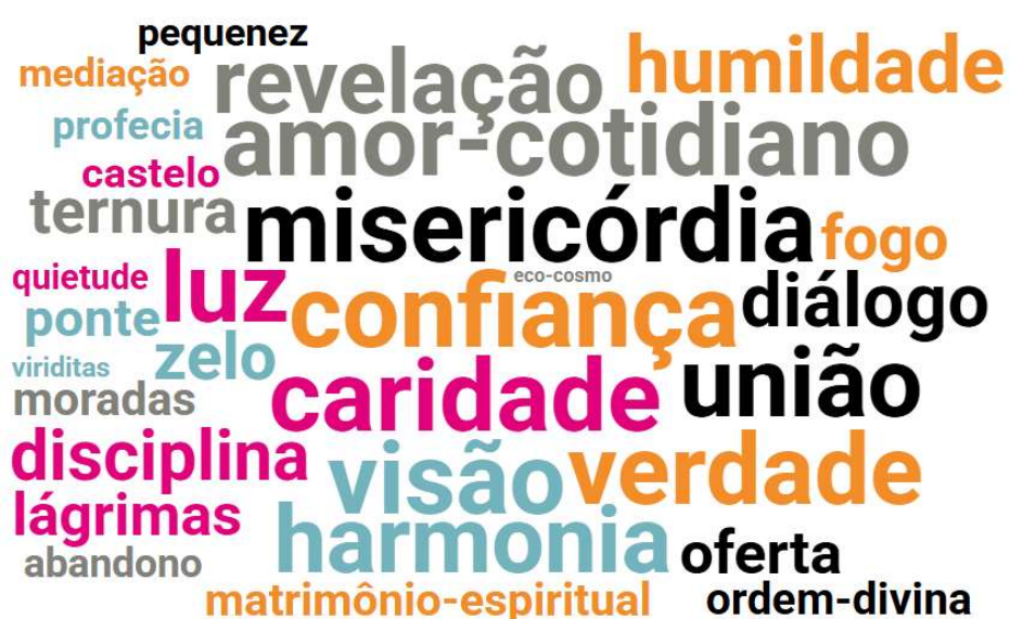
Figura 1: Êxtase pela ótica das quatro doutoras da Igreja

Ao tratar de êxtase intenciono refletir com o murmúrio das místicas manifestados em comunicações, escritos, pregações tanto de maneira simples como exigente, com a tentativa de transmitir o que de intenso vivenciavam na relação direta com Deus. Esta via não é fazer espetáculo, mas sim expressar o amor do dia a dia, desde os trabalhos de convencimento a um Papa ou ao ofício de dar alimento a quem tem fome. A concentração real, nítida, advinda da atenção. Em Teresa a alma é um castelo; para Catarina a verdade é ponte e ferida; em Teresinha é a pequenez e em Hildegard é o fogo espiritual, a viriditas.