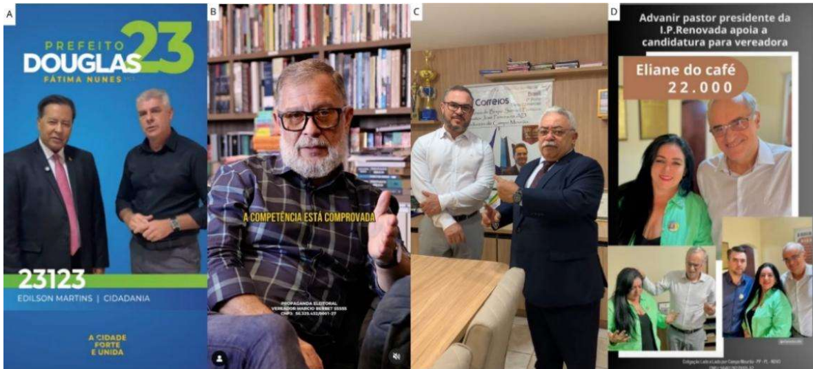
Imagem 3: Declaração de apoio das lideranças eclesiais